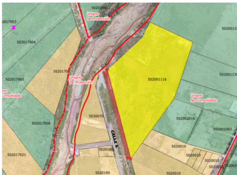
UBICACIÓN DEL PREDIO GEODATABASE