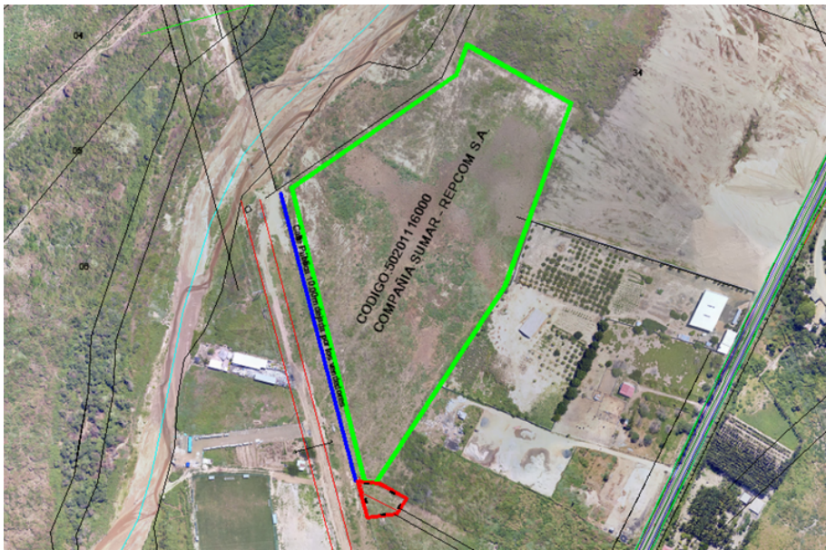
AREA DE CALLE PUBLICA

POR EL COSTADO IZQUIERDO: Con seis metros noventa y seis centímetros más cuatro metros dos centímetros y lindera con área de protección del Poliducto.